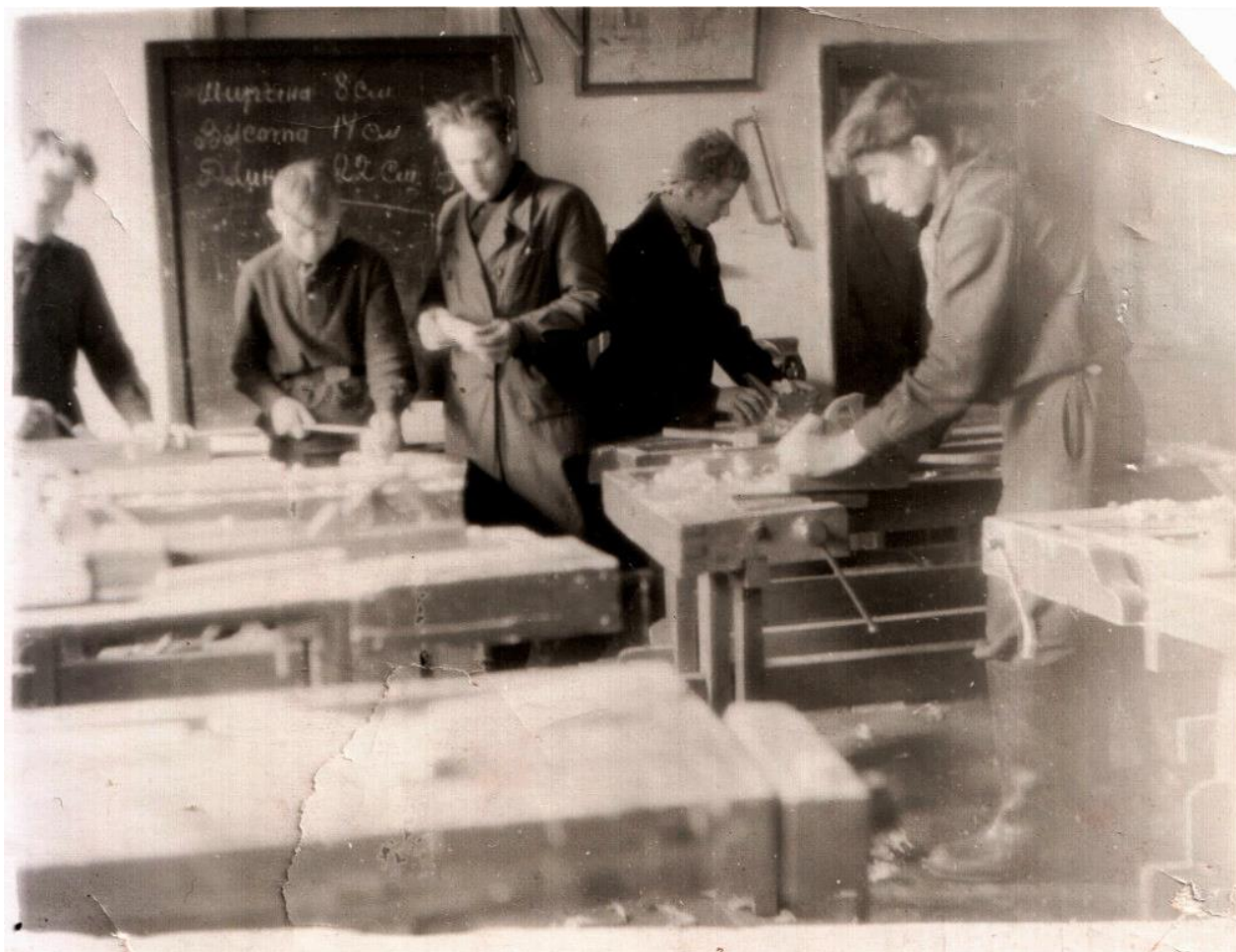
Рис 4. Школьная столярная мастерская.

Васильевичу никак не удавалось нас успокоить. В один момент, чувствуем, палатка упала прямо на нас! Таким образом, вытащив колья, удалось учителю успокоить своих неугомонных питомцев!