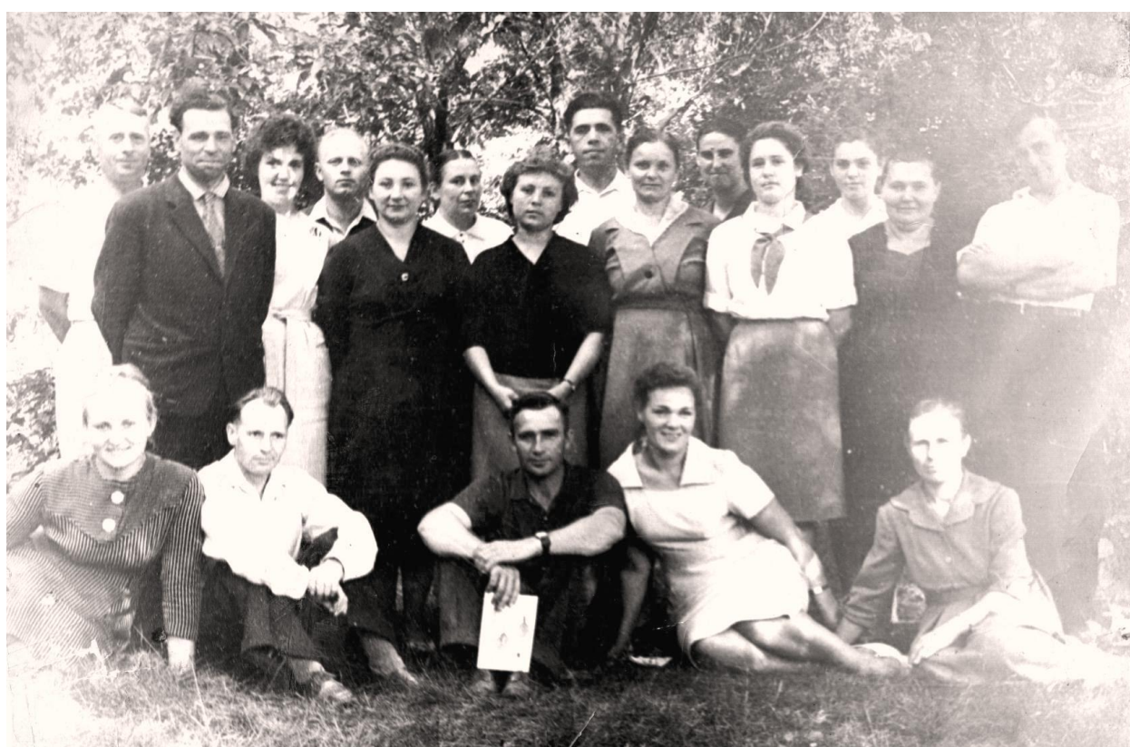
Рис.15. Наши родные учителя. Кого - то уже нет в живых, но светлая память о них жива!