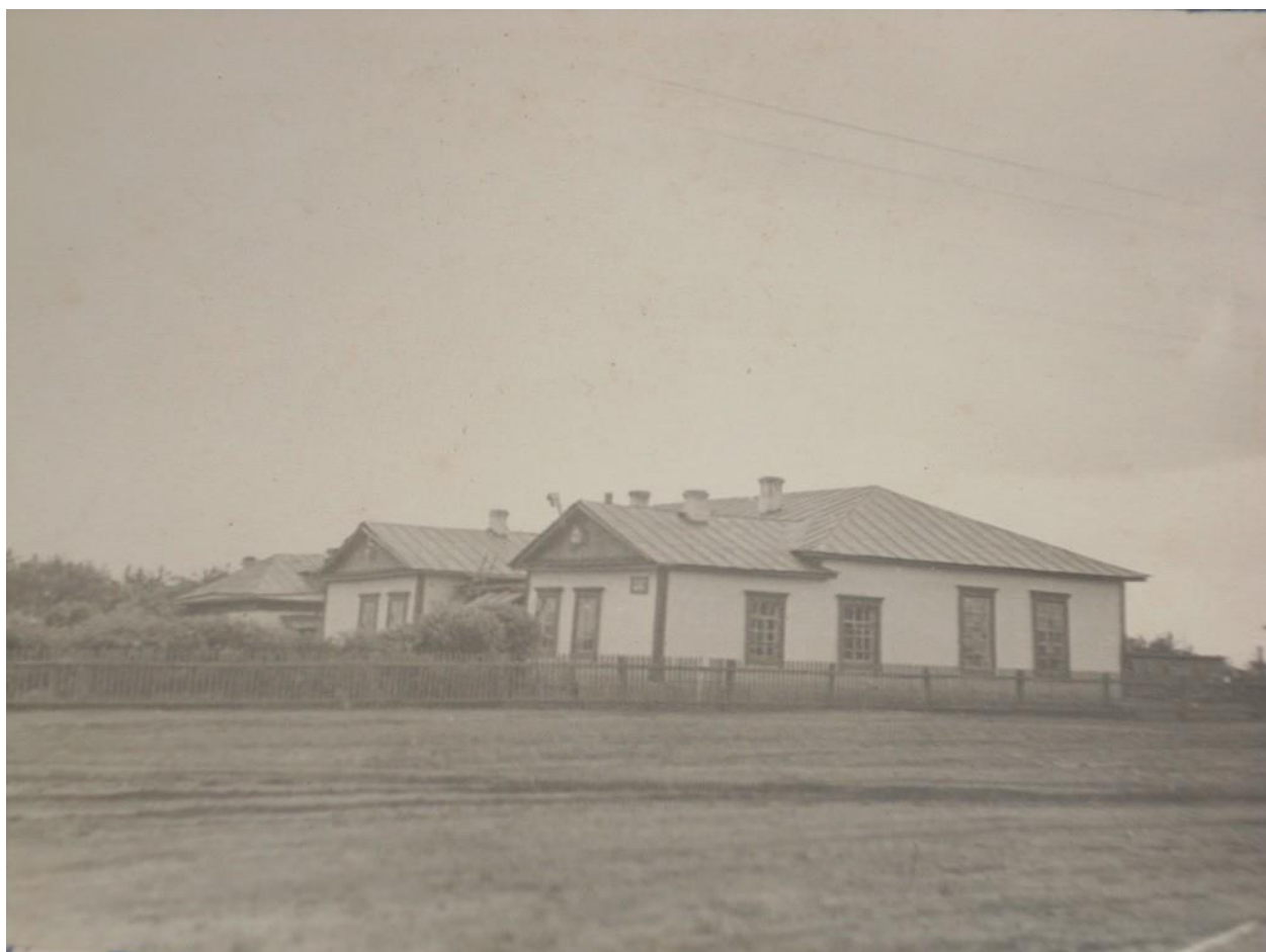
Рис 17.Шингак-кульская школа ВЧЕРА