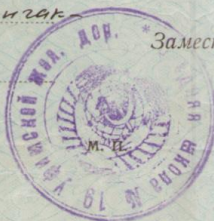
Рис.13. аттестат выпускника средней школы № 19 ст. Шингак – Куль Уфимской ж/д, 1959г.