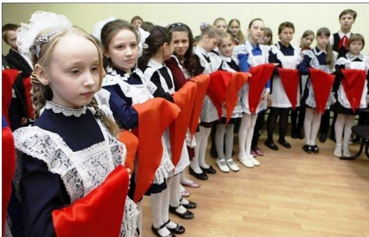
Рис.19 Пионеры Всесоюзной пионерской организации.