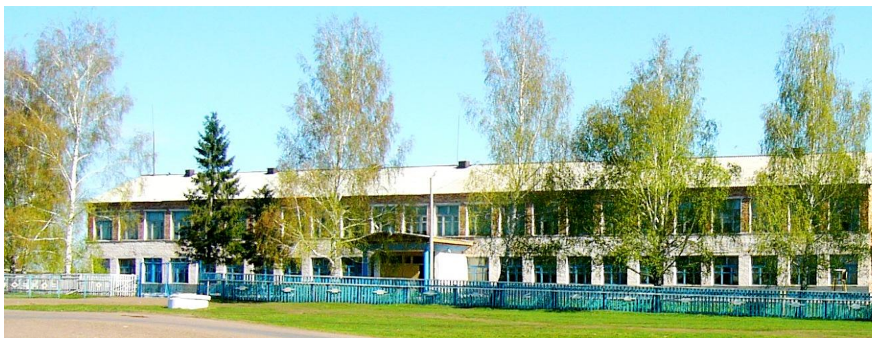
Рис.18.Шингак-Кульская школа СЕГОДНЯ.