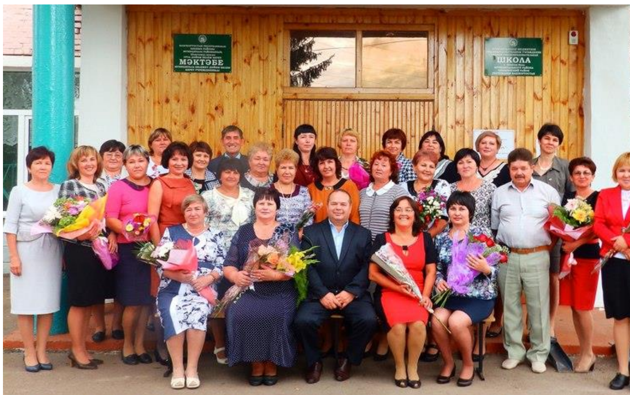
Рис.16. Коллектив учителей. 2016г.