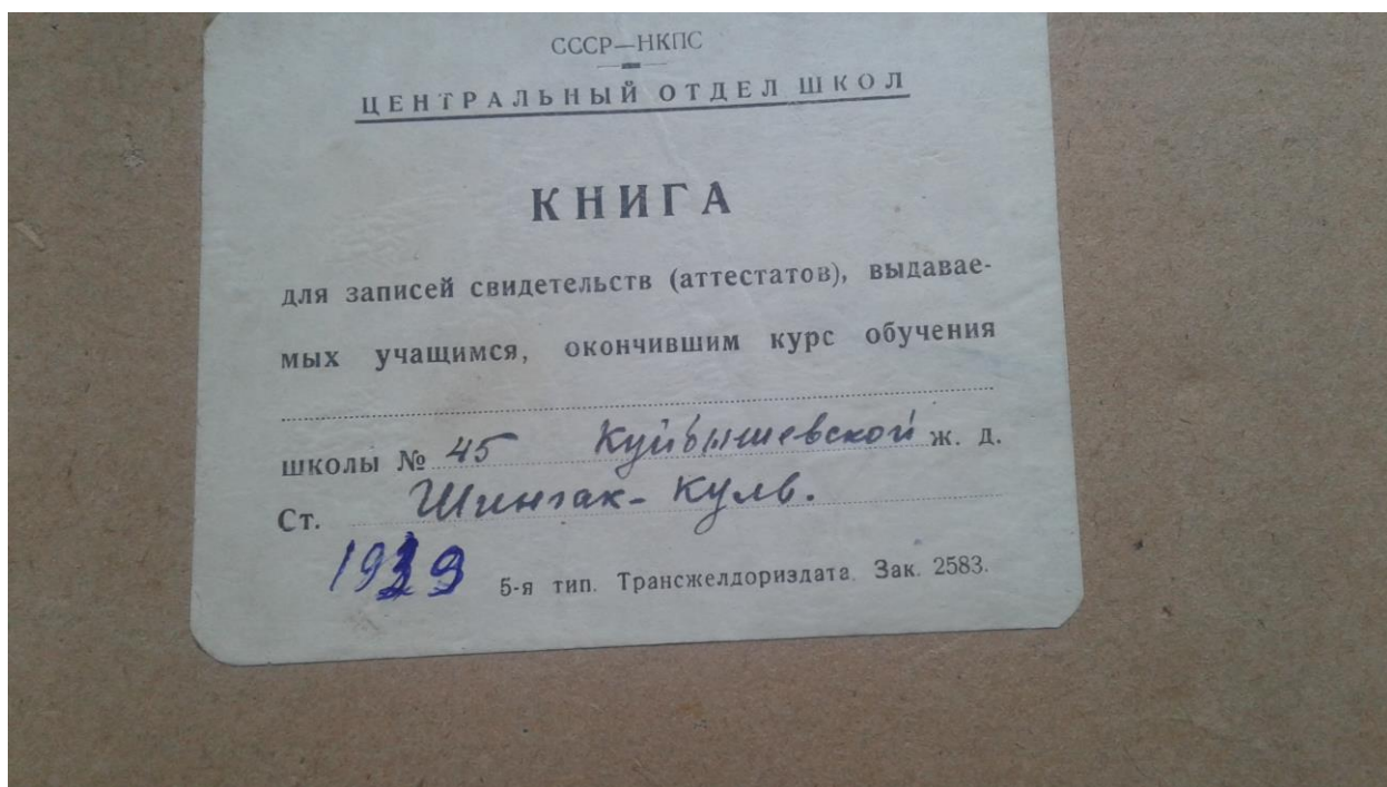
Рис. 12. Книга записей аттестатов 1939.

В архиве нашей школы сохранившиеся «книга записи выданных аттестатов», датированная 1939 годом, подтверждает принадлежность к железной дороге. На титульном листе записано «НКПС, центральный отдел школ», а школа носила название «№ 45 Куйбышевской железной дороги ст. Шингак-Куль». (рис.12)