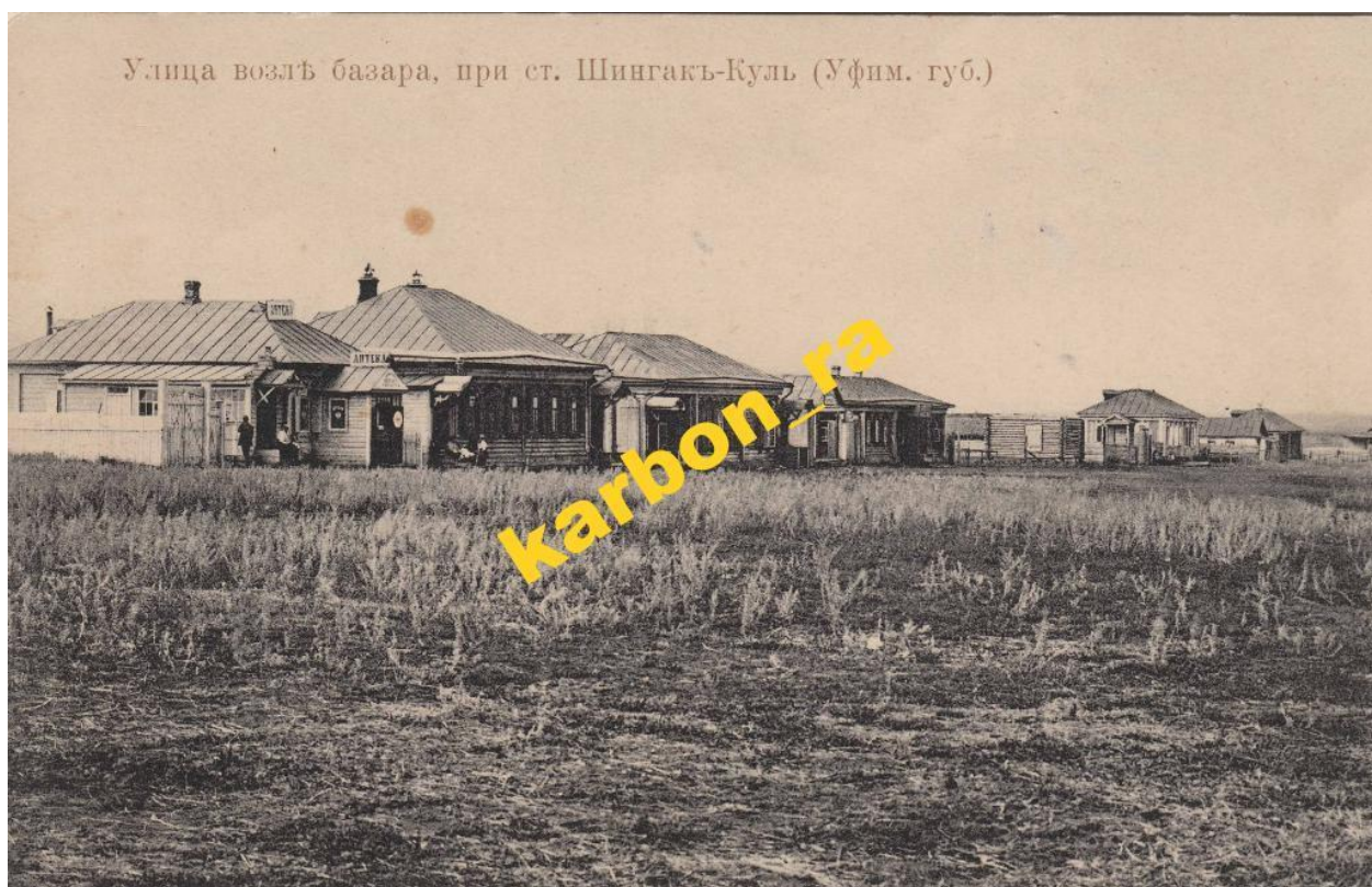
Рис.8 ст. Шингак-Куль.1888г

Предположительно в Шингак-Куле, основанном в 1884 году на территории Уфимского уезда в связи со строительством Самаро-Златоустовской (позже Куйбышевской) железной дороги как поселка Станции Шингак-Куль, земская школа была открыта в 1911 году. Вполне реально, потому что уже в 1896 году проживало 44 человека. По завершению строительства железной дороги численность стрелочников, мастеров, грузчиков, работников возросла, и население к 1920 году составила 588 человек в 98 дворах. При станции был буфет, а также выполнялись почтово - телеграфные операции, о чем есть запись в Адрес – календаре Уфимской губернии за 1910 год в списках телеграфно – почтовых отделений и станций, выполняющих почтовые операции - значится ст. Шингак – Куль .